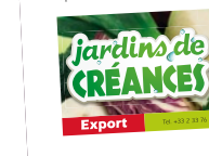
jardins de créances

« Travailler ensemble au niveau européen ». « Travailler ensemble au niveau européen ». « Travailler ensemble au niveau européen ».