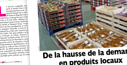
De la hausse de la demande en produits locaux

Vendre des f&l en informant les internautes. Vendre des f&l en informant les internautes. Vendre des f&l en informant les internautes.